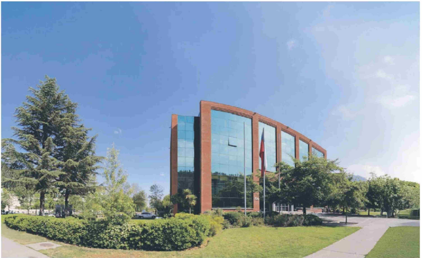
El nuevo Parque de Ciencia, Innovación y Emprendimiento de la Universidad San Sebastián en Huechuraba.