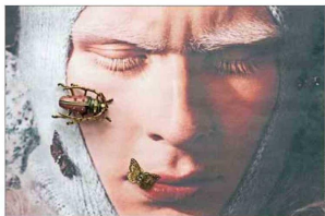
Trabajo de Fabián Corada para Vanguard Magazine, en el Festival de Fotografía Editorial.

Participarán 45 editoriales nacionales y nueve extranjeras, de Argentina,