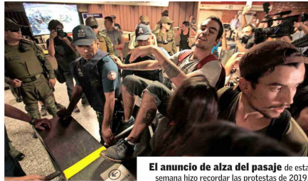
El anuncio de alza del pasaje de esta semana hizo recordar las protestas de 2019.