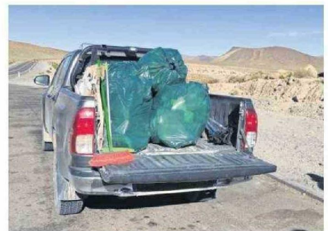
ABUNDAN LOS RESTOS DE CARGA Y DESECHOS BIOLÓGICOS

Ruta 11CH. "A la fecha hemos llegado a casi 200 choferes en 7 meses, tratando de impulsar una cultura de cuidado de parte de quienes transitan por la ruta, como no tirar basura o no dejar desechos biológicos en el camino, generando focos de contaminación que finalmente afectan el hábitat de la Reserva en la que conviven especies protegidas, en condi-