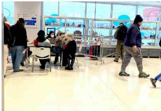
Quienes han acudido al recinto durante los últimos días, han notado el frío que se siente dentro del Hospital.

Por ello, Canteros entregó el siguiente mensaje a la comunidad: “Paciencia, eso se va a resolver, es un tema para nosotros importante, que nos genera incomodidad y frustración, pero aquello va a ser resuelto a la brevedad”, cerró.