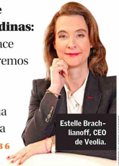
Estelle Brachlianoff, CEO de Veolia.

"Si no se hace nada, llegaremos a que será necesario desalar agua de mar para Santiago" B 6