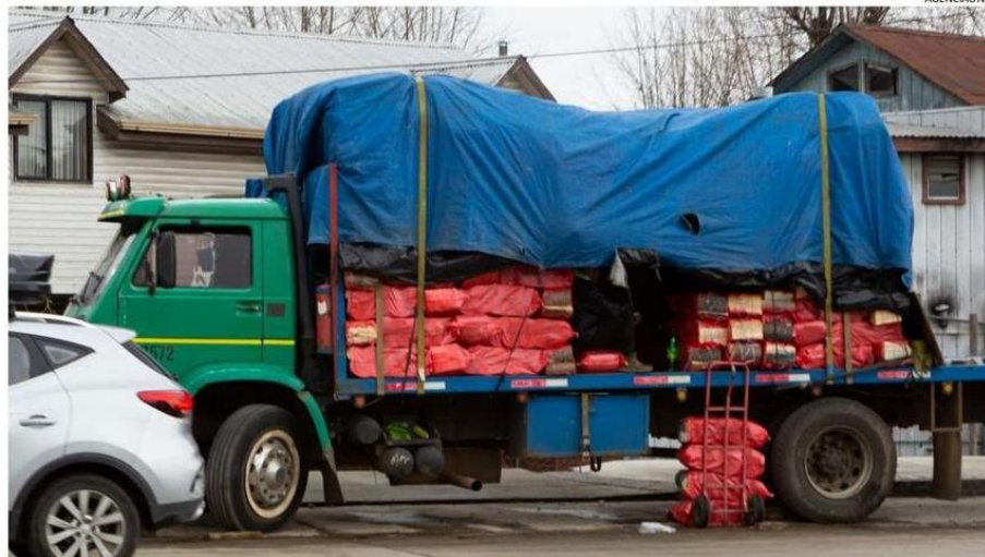
LA SEREMI DE ENERGÍA EXPLICA QUE HAN REALIZADO UNA SERIE DE FISCALIZACIONES A LOS CAMIONES QUE COMERCIALIZAN LEÑA.