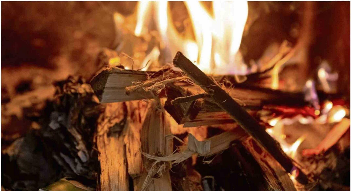
DOS MILLONES 490 MIL METROS CÚBICOS DE LEÑA SE UTILIZAN AL AÑO EN LA REGIÓN, SEGÚN ESTUDIO.