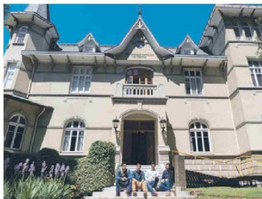
Campus Monseñor Alejandro Mechaca Lira.