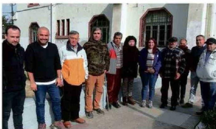
CELEBRARON LA DECLARATORIA TRAS LA VOTACIÓN.