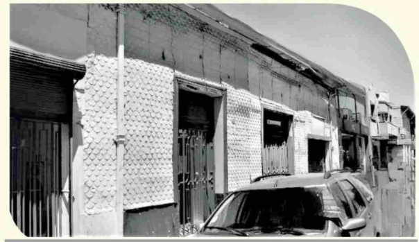
Lugar donde inició sus labores el Liceo de Linares, Independencia esquina Lautaro(Fuente de Soda Santa Ana).