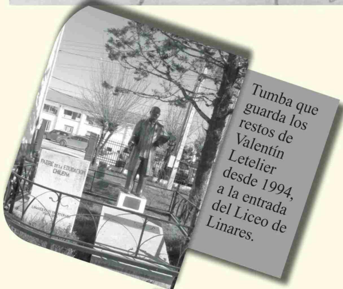
Tumba que guarda los restos de Valentín Letelier desde 1994, a la entrada del Liceo de Linares.