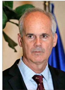
Senador Rodrigo Galilea.