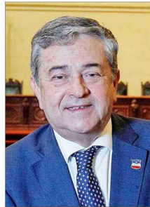
Senador Juan Antonio Coloma.

2 No hay acuerdo sobre la cotización: se acuerda subir 6 puntos la cotización, pero no lo hay sobre cuántos puntos de cotización irán a las cuentas individuales y cuántos a reparto.