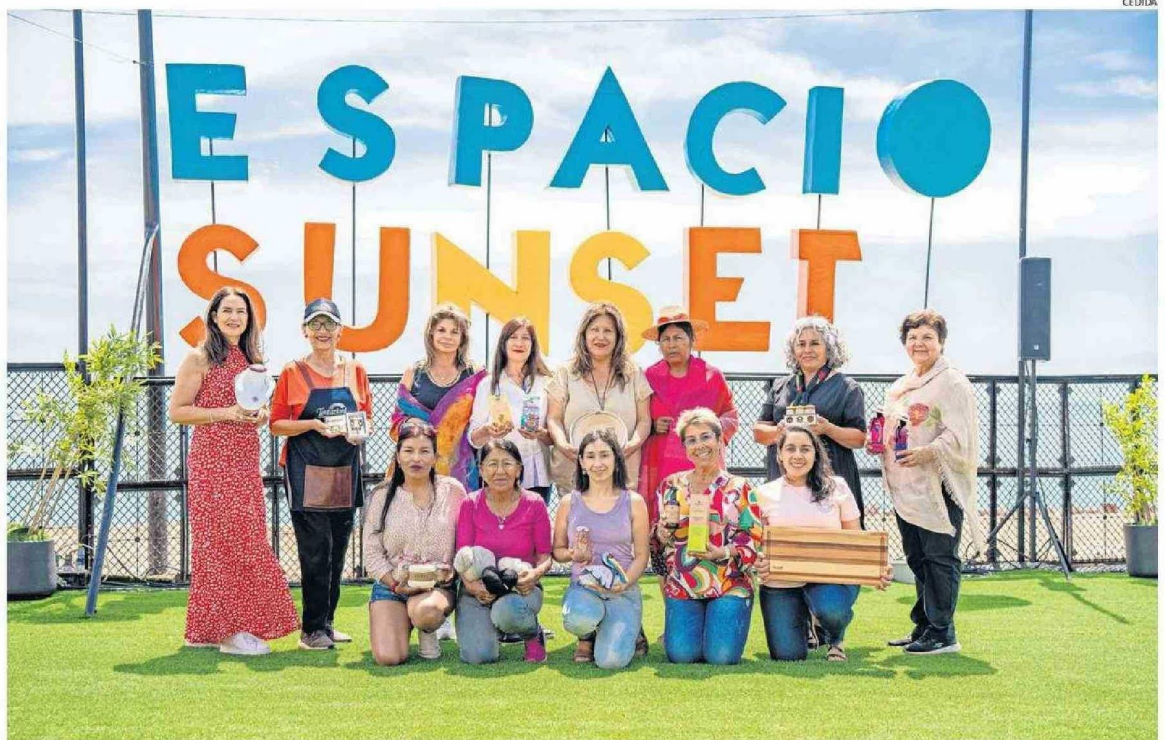
LAS EMPRENDEDORAS OFRECERÁN PRODUCTOS DE DECORACIÓN, ARTESANÍA, JOYERÍA, TEXTILES Y MÁS.

Los visitantes encontrarán productos de diversos