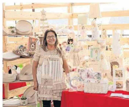
“AMY DECO”, ES UNO DE LOS EMPRENDIMIENTOS PRESENTES.

rubros, como artesanía, decoración, joyerías y bisutería, infusiones, chocolatería, prendas y accesorios en cuero, artículos a base de vidrio reciclado, textiles, jardinería y vestuario, entre otros.