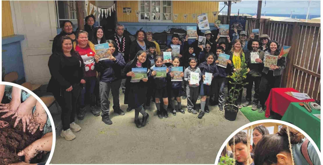
EL DÍA Los miembros de la comunidad, desde niños hasta adultos, participaron activamente en la construcción y el cuidado del huerto

Y es que es mediante esta huerta escolar ecológica, que los habitantes de la caleta de la comuna de Ovalle, estudiantes y apoderados aprenden a cultivar la tierra, a reciclar los residuos orgánicos y a aprovechar el recurso hídrico.