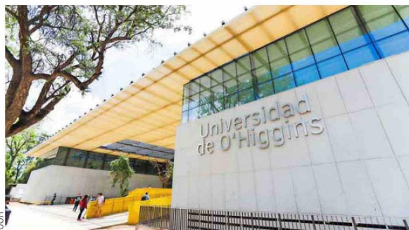
Actualmente, la UOH cuenta con 27 carreras de pregrado y más de 7.000 estudiantes cursando pregrado durante 2024.

La autoridad UOH destacó los distintos hitos que han marcado los primeros años de la casa de estudios regional y estatal.