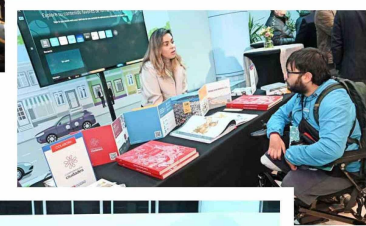
Las diversas fundaciones que participaron del encuentro explicaron los proyectos que están impulsando para la revitalización de los espacios públicos.