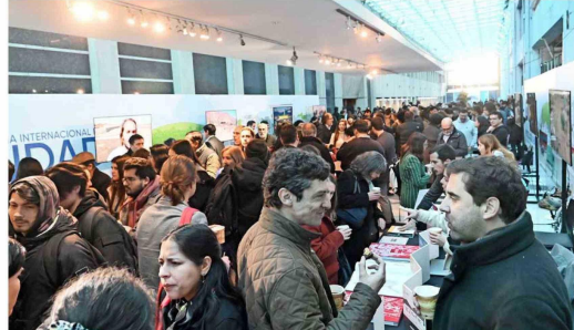
H colaboradores entre fundaciones y universidades fueron parte de la "Conferencia Internacional de Ciudad 2024".