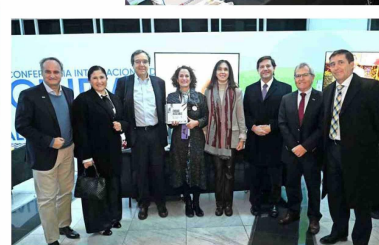
Autoridades de la CChC visitaron el stand de la Corporación Ciudad Accesible.