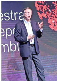
El invitado internacional Guillermo Peñalosa expuso sobre la "Creación de Ciudades 8-80 para todos. Sostenibles, equitativas y divertidas".