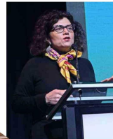
Paola Jirón, presidenta del Consejo Nacional de Desarrollo Territorial, expuso sobre la nueva política nacional de Desarrollo Urbano.