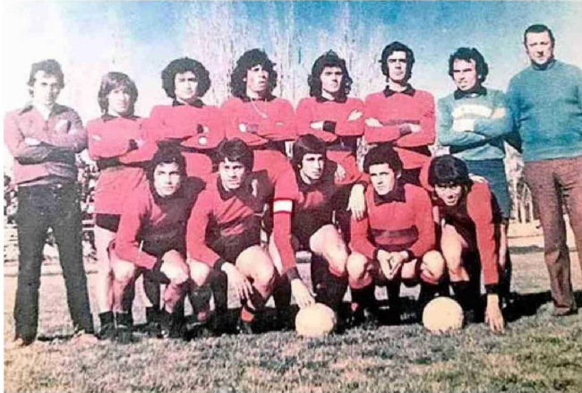
Rangers 1979: Capitán y, goleador del equipo con 10 goles.