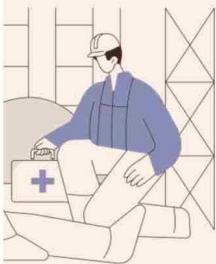
EN BASE A SUSSESO Y AL DE EMPLEO DEL IINE.

“El total de días de licencia al año pagados en promedio por trabajador dependiente del sector público es considerablemente mayor al observado entre trabajadores dependientes del sector privado e independientes.