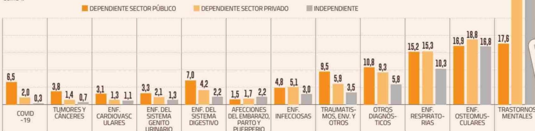
DISTRIBUCIÓN DE LAS LICENCIAS AUTORIZADAS EN 2023 POR GRUPO DE DIAGNÓSTICO SEGÚN TIPO DE TRABAJADOR COMO %