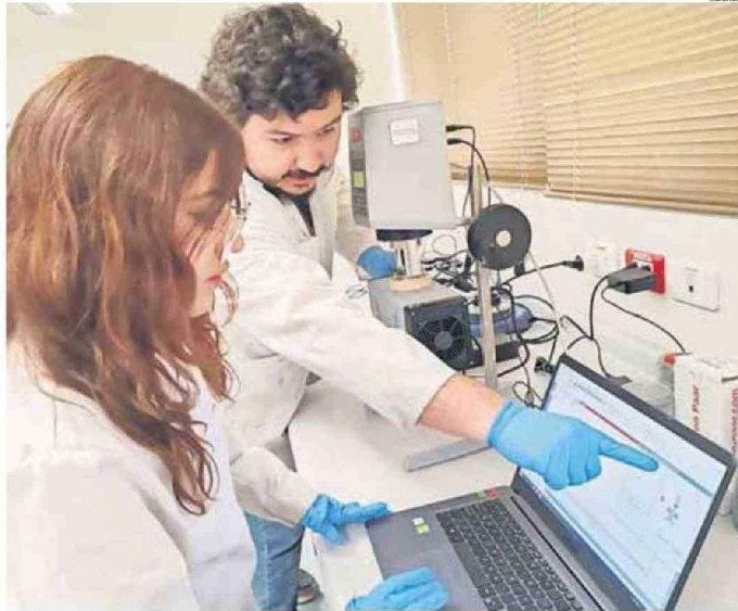
EN CHILE, SE GENERAN 140.000 TONELADAS DE NEUMÁTICOS FUERA DE USO Y SOLO UN 17% ES MANEJADO.

En Chile, se generan 140.000 toneladas de neumáticos fuera de uso y solo un 17%