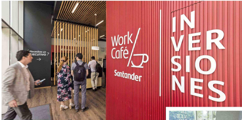
El área de Wealth Management del banco tuvo importantes avances durante el año pasado, especialmente en la unidad de Banca Privada y en Santander Asset Management.