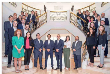
Santander Asset Management fue reconocido en múltiples ocasiones, consolidando su posición como líder en la industria de los fondos mutuos.

banco, señaló que "nuestros equipos buscan constantemente las mejores opciones en los diferentes mercados, analizando distintos instrumentos de inversión, los cuales se mueven en un entorno económico que enfrenta múltiples desafíos. Por eso, haber contado nuevamente con la confianza de nuestros clientes durante 2024 es algo que nos llena de orgullo y nos motiva a seguir trabajando, no solo para lograr la mejor rentabilidad, sino que también para desarrollar soluciones innovadoras que los ayuden a resolver sus necesidades, acompañados además de la asesoría experta de nuestros ejecutivos".