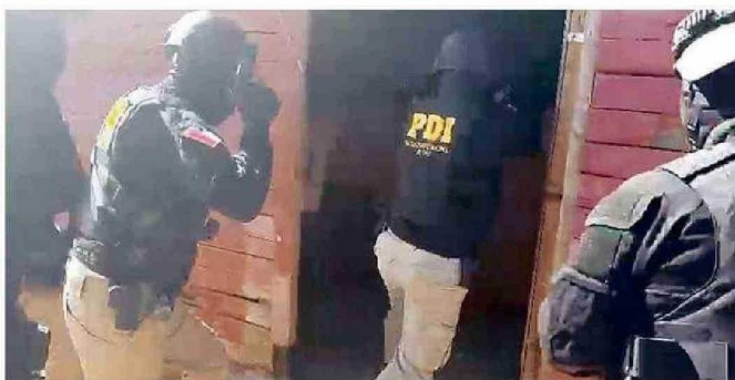
CAYERON EN MEGAOPERATIVO DE LA PDI REALIZADO ESTA SEMANA.

Errázuriz, en el centro de Cartagena. La vivienda era un verdadero fuerte que cuenta con distintos medios de acceso y cubierta por mallas de raschel para impedir la visual.