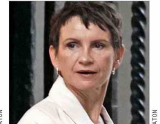
Carolina Tohá (PPD), ministra del Interior.