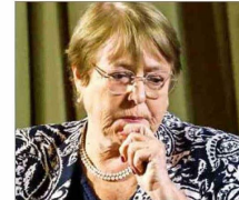
Michelle Bachelet, exministra en dos períodos.

Al frenesí que supone retomar una nutrida agenda legislativa