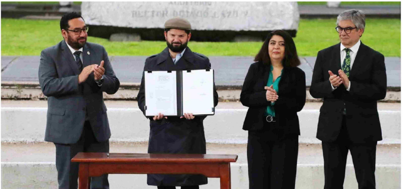
► En el gobierno asumen que para que el proyecto salga adelante, deben estar abiertos a modificaciones.