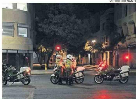
AYER SE LEVANTÓ EL TOQUE DE QUEDA PARA LAS REGIONES AFECTADAS.

transmisión. “Corresponde una compensación por todo el tiempo de duración del suministro, que es del orden de 15 meses del precio de la energía no suministrada”, dijo Pardow, quien aseguró que en este caso los descuentos se realizarían de manera automática en las cuentas de la luz, los que espera que se realicen lo “antes posible”.