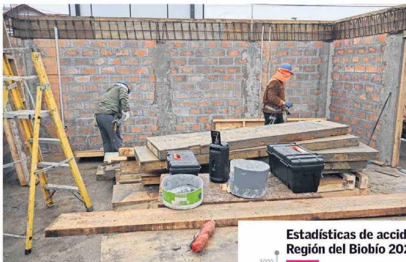
Sectores industria y manufactura, en general, se alzan como los rubros con mayores hechos de accidentabilidad en el trabajo.

Se alcanzó el 55%. "En esos casos, en promedio, fueron como 43 días de ausentismo. Entonces eso ya implica una pérdida de productividad muy importante para la organización, además del daño en el bienestar de la persona trabajadora. De esas enfermedades de salud mental, más del 80% se deben a sobrecarga, hostigamiento y conflicto laboral. Tenemos que abordarlo desde la gestión preventiva", indicó Gana. Sobre cuáles son los sectores económicos en los cuales la salud mental ha presentado mayor incidencia en las empresas, Gana añadió que "uno de los más importantes es servicios y eso es a nivel nacional. La salud mental es un tema generalizado, pero en servicios, sobre todo en el área educación y salud". A esto, sumó que se debe trabajar una metodología establecida que minimice los impactos tanto en trabajadores como en las mismas organizaciones.