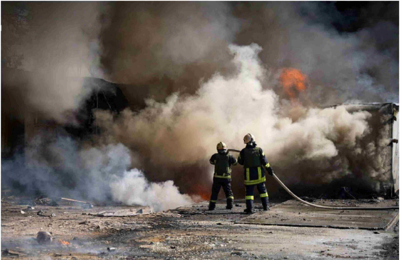
► Los bomberos trabajan en el lugar de un ataque de misil ruso, en la región de Odesa, Ucrania, el 26 de agosto de 2024.