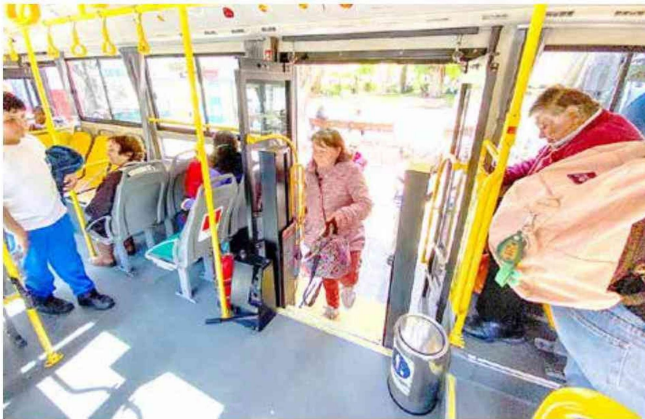
Para este año se proyecta que 200 mil usuarios usen este servicio.

Cero contaminación. Continuando con el compromiso del Municipio talquino de convertirse en una ciudad con movilidad sostenible, este medio de transporte limpio se ha convertido en un referente nacional, no solo por ser eléctrico y aportar al cuidado del medioambiente, sino por su atención preferencial y gratuita al adulto mayor y a personas en situación de discapacidad.