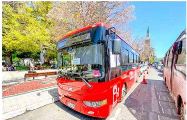
El servicio de buses eléctricos de Talca se ha convertido en un referente a nivel nacional.

la ciudad. Con un tiempo de carga por bus de solo 45 minutos, puede operar de manera eficiente durante todo el día sin necesidad de una nueva carga, puesto tiene una autonomía por carga de 120 kilómetros y la ruta de cada bus, es de aproximadamente 100. De esta forma, la flota compuesta por ocho buses, recorre 16 mil kilómetros al mes sin emitir un solo gramo de CO2. Este servicio, que se mantiene operativo gracias a la dedicación de los nueve choferes y asistentes que conforman el equipo, ha logrado alcanzar un promedio mensual cercano a los 16 mil usuarios, proyectando