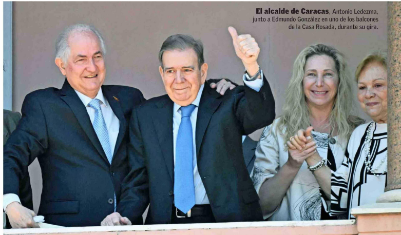
El alcalde de Caracas, Antonio Ledezma, junto a Edmundo González en uno de los balcones de la Casa Rosada, durante su gira.

—El Presidente Boric ha demostrado con su conducta que este no es un problema ideológico. El crimen organizado no es de derecha ni de izquierda, los crímenes de lesa humanidad no tienen una etiqueta ideológica. Los robos al erario público no tienen una identidad. El Presidente Boric ha condenado los delitos cometi-