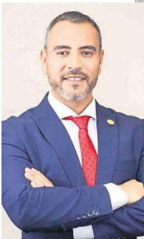
FABIÁN OSSANDÓN CANDIDATO A GOBERNADOR REGIONAL (INDEP.).

Impulsaremos una comisión permanente de seguimiento y fiscalización de los proyectos apro-