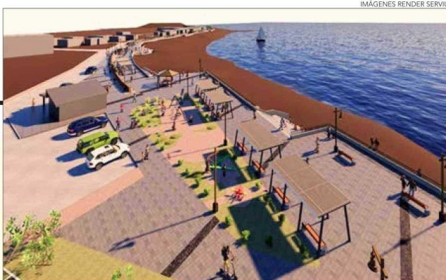
IMÁGENES RENDER SERVU