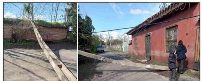
Otro poste que cayó en el lugar, impidiendo hasta el paso de peatones.