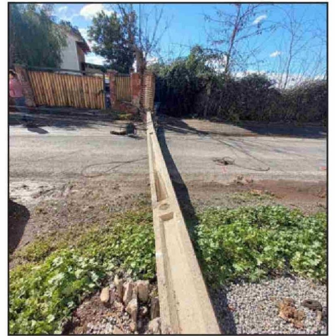
Uno de los postes caídos en Bucalemu, atravesando de lado a lado la calzada.