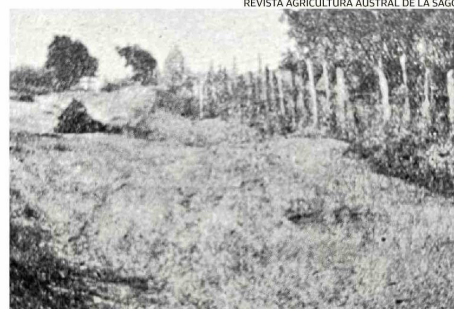
REVISTA AGRICULTURA AUSTRAL DE LA SAGO