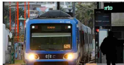
Tren a La Calera, buses eléctricos, futuro del terreno en Las Salinas y reconstrucción tras el megaincendio: ¿Qué opina la ciudadanía?