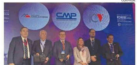
GALARDONADOS EN “SEGURIDAD Y SALUD OCUPACIONAL”.