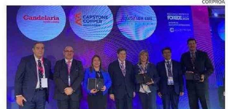
RECONOCIDOS POR “APORTE AL DESARROLLO SOCIAL”.