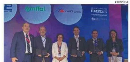
LOS RECONOCIDOS POR “SUSTENTABILIDAD”.