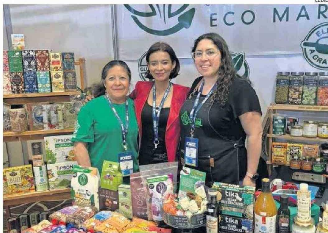
EMPRENDEDORES TAMBIÉN ESTUVIERON PRESENTES CON PRODUCTOS LOCALES.

ria Lunding Mining y Sodexo por su labor en la creación de ambientes laborales inclusivos y diversos. Finalmente, en la categoría de Medios de Comunicación, la Revista Minera Crisol, el Diario Chañarillo y Radio Nostálgica recibieron premios.