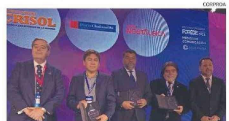
LOS DESTACADOS COMO “MEDIOS DE COMUNICACIÓN”.