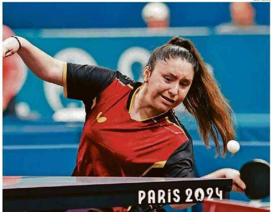
LA CHILENA LUCHÓ PARA PODER METERSE EN LA FINAL EN LOS PARALÍMPICOS.

La oriunda del Ñuble analizó el partido y detalló la categoría de la deportista china. “El partido perdido fue muy complicado. La china juega mucho. Nunca ha perdido un partido desde la final de Tokio 2020. Tenía muy buena estrategia,