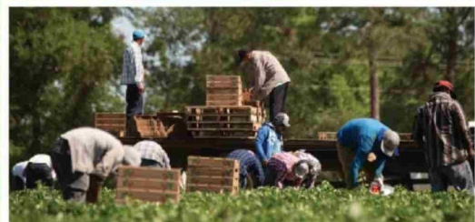
LA SNA LLAMÓ A ANALIZAR EN QUÉ GRADO la nueva Ley de Migración y Extranjería puede fomentar no intencionadamente la migración irregular y la informalidad.