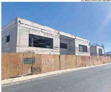
LA LICITACIÓN DE LAS OBRAS SE ABRIRÁ EN LOS PRÓXIMOS MESES.