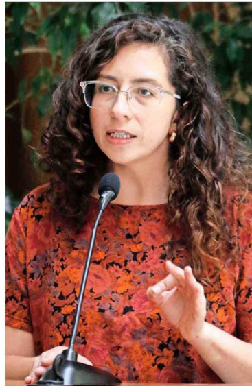
Diputada Gael Yeomans (Convergencia Social).