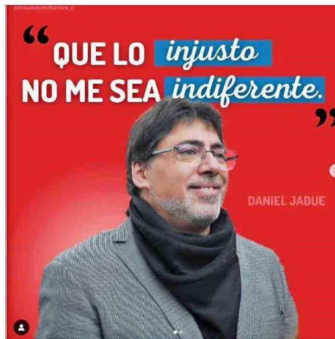
Página de Instagram "Jadue Libre".

El grupo está aún en formación y este jueves se presentaría como una iniciativa más concre-