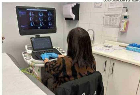
PARA 2025 SE PROYECTA AMPLIAR LOS PROGRAMAS Y ESPECIALIDADES.

Detalla que uno de los principales ejes de acción de la Corporación es precisamente la reducción de las listas de espera, mediante la realización de operativos médicos especializados desde 2021 en adelante. Así, estas alianzas estratégicas entre el sector público y privado han permitido resolver problemáti-