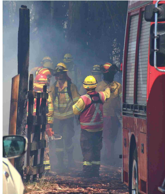
Cuatro incendios de vegetación y con riesgo de viviendas se han registrado en lo que va del año en Labranza.

llegaron alarmados al enterarse de que el fuego estaba a punto de