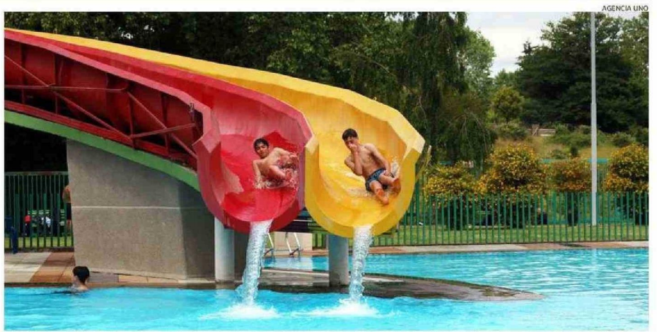
PESE A QUE EL DÍA ESTUVO ALGO NUBLADO, IGUAL LLEGARON BAÑISTAS A DISFRUTAR DE LAS PISCINAS DEL PARQUE CHUYUCA Y DE SUS ATRACTIVOS.

las piscinas, de todas las áreas verdes y también de canchas de fútbol, básquetbol y de tenis, que también tenemos en el lugar", detalló.