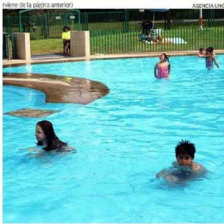
LAS PISCINAS DE CHUYUCA CONTEMPLAN ESPACIO PARA LOS MÁS PEQUEÑOS.

bañistas en la zona, que son alrededor de mil.