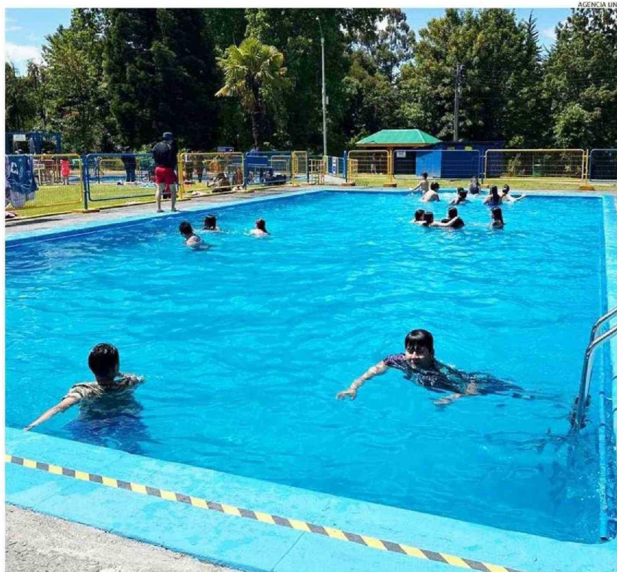
LAS PISCINAS DEL CAMPING OLEGARIO MOHR HAN TENIDO ALTA DEMANDA DE DELEGACIONES Y PASEOS DE CURSO.

“En todo caso, no será mucho el incremento, más que nada para cerrar los montos, en realidad más por el tema del sencillo al pagar”, aseguró.