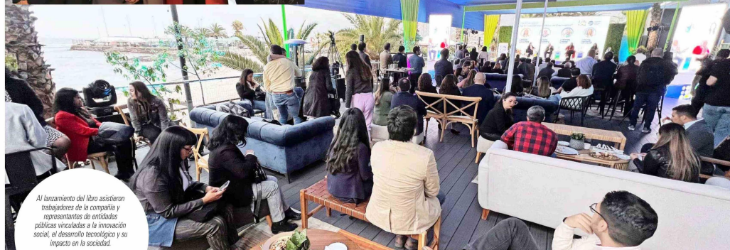
Al lanzamiento del libro asistieron trabajadores de la compañía y representantes de entidades públicas vinculadas a la innovación social, el desarrollo tecnológico y su impacto en la sociedad.