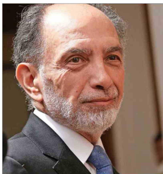
Sergio Muñoz, ministro de la Corte Suprema y actual presidente de la Tercera Sala.