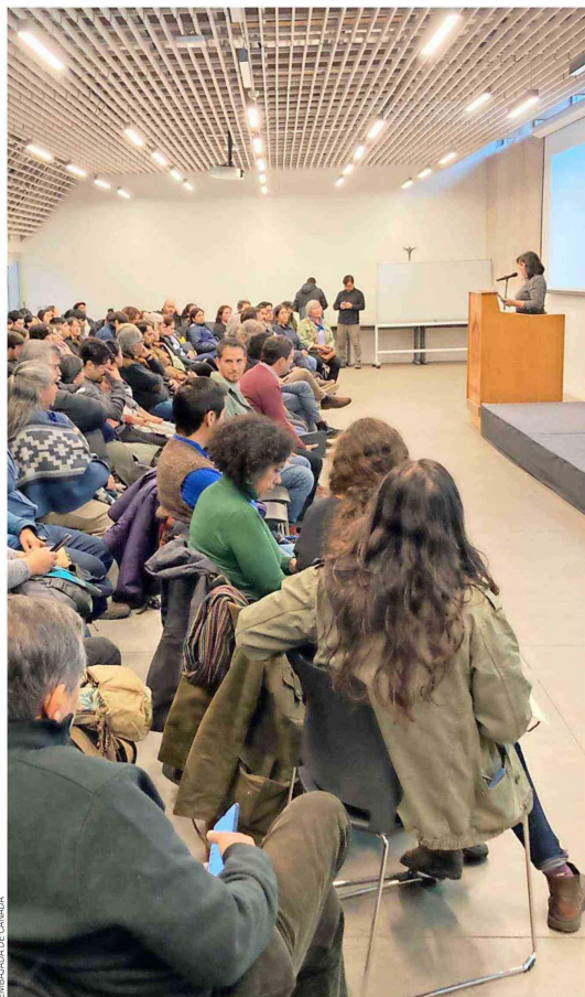
La visita generó mucho interés en la región.

Diversos fueron los intercambios y los conocimientos que pudieron compartirse en esta instancia de encuentro entre instituciones canadienses y comunidades Mapuches de la región de La Araucanía.