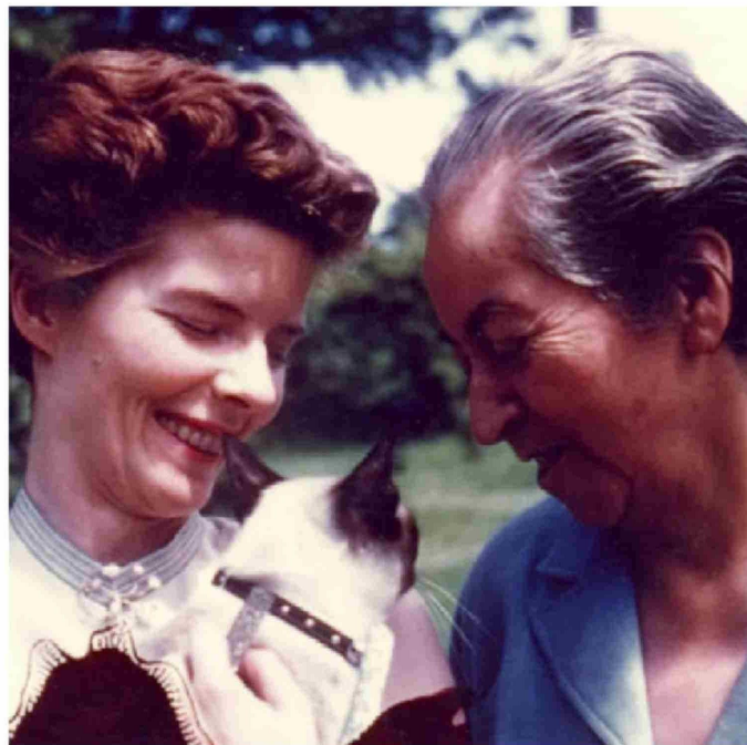
► Gabriela Mistral obtuvo el Premio Nobel de Literatura en 1945.

En suma, incorporar la vida privada de Mis-