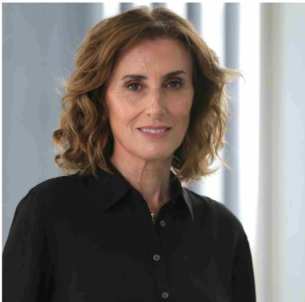
► La exministra de Educación del expresidente Piñera, Marcela Cubillos, actualmente es candidata a alcaldesa por Las Condes.

Conocedores del trabajo de la exsecretaria de Estado afirman que, precisamente por su rol en Libertad y Desarrollo, en un inicio tenía una menor vinculación con la casa de estudios y que durante ese período ejerció solo labores de docencia. Posteriormente se le