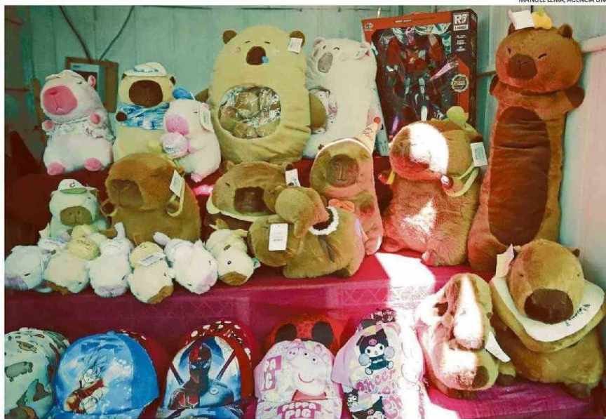
FERIA NAVIDEÑA DE PARQUE ITALIA FUNCIONARÁ HASTA EL 25 DE DICIEMBRE. SU HORARIO DE ATENCIÓN ES DE 10.00 A 20.00 HORAS.

“El capibara más grande, que trae guaguaitas en su interior, vale 28 mil pesos, el que le sigue sale $20 mil y el de estilo hamburguesa vale $18 mil. Los más chiquititos, que son como llaveros, valen entre 5 y 4 mil pesos. Tenemos agenda, lápices y marcadores también, que parten en los dos mil pesos. Los valores son accesibles”,