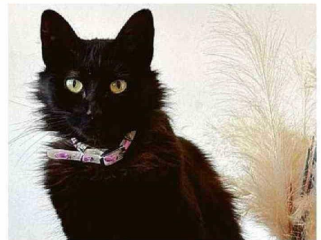
DESTACAN A LÍA COMO MASCOTA CARIÑOSA, CASERA Y REGALONA.