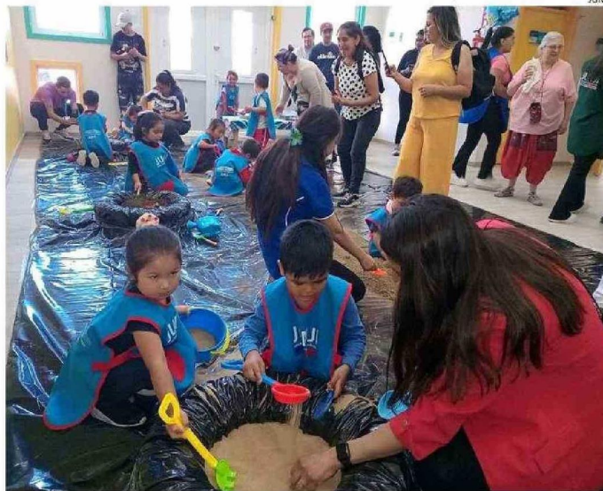
LUEGO DE UN MES DE ACTIVIDADES, EN EL JARDÍN INFANTIL "NUEVA GENERACIÓN" DE TEMUCO SE REALIZÓ EL CIERRE DEL PROGRAMA.