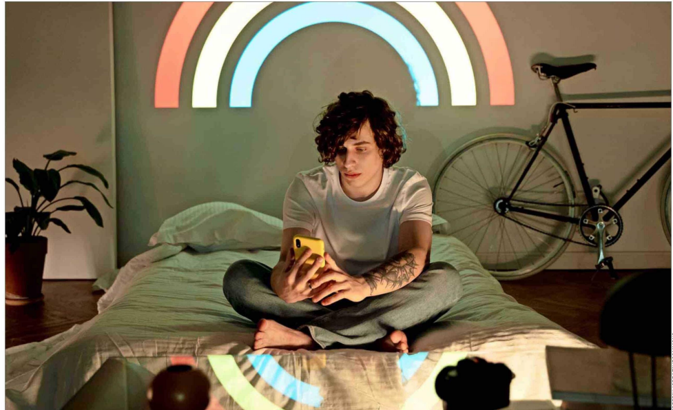
Múltiples estudios indican que los jóvenes prefieren chatear o navegar por internet antes que salir de noche.

"Estamos ante un cambio cultural. Esta es una generación